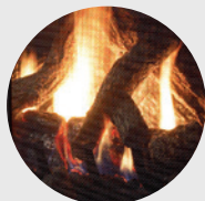
LOGC31 Ensemble de bûches chêne fendu