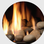
MQROCK3 Roches multicolores