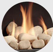
MQROCK2 Roches naturelles